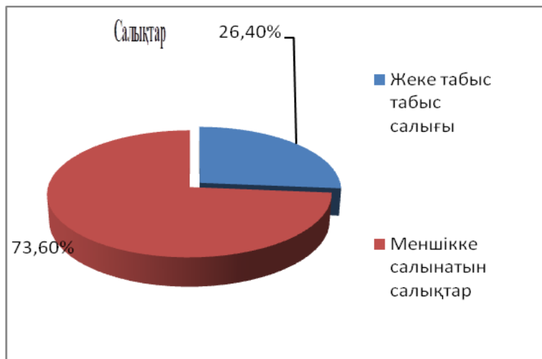
Салық түсімдері түрлерінің үлесі, 2018 жыл., %

2018 жылғы Нұрлыкент ауылдық округ бюджетінің салықтық түсімдерін негізінен жеке табыс салығы 1 112 мың теңге, меншікке салынатын салығы 3 106 мың теңге, оның ішінде Мүлікке салынатын салықтар 56 мың теңге, жер салығы 322 мың теңге, көлік құралдарына салынатын салықтар 2 728 мың теңгеге қалыптастырады.