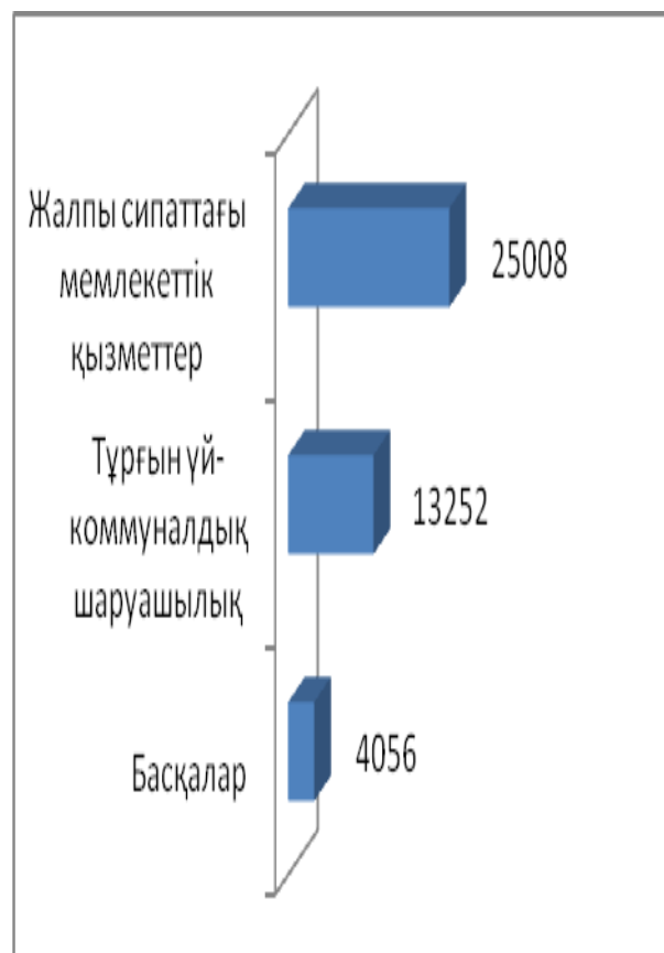
Нұрлыкент ауылдық округі бюджетінің 2018 жылға арналған шығыстары (мың.теңге)

Жалпы шығындар көлемінің үлкен үлесі: Жалпы сипаттағы мемлекеттік қызметтердің шығындары- 59,1 %, тұрғын үй коммуналдық шаруашылық-31,3 %, басқалар – 9,6 %,